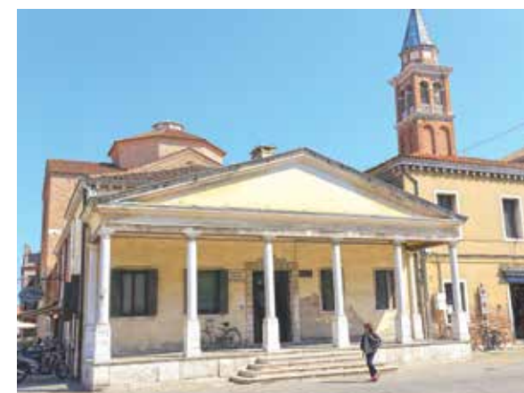
Tole je policijska postaja.