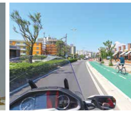
Betonsko turistično naselje Sottomarina v sami bližini Chioggie pa je povsem druga zgodba ...

bragocev, so šli našim ribičem z majhnimi čolnički seveda v nos. Neredko so se tepli in leta 1896 so se pod vasio Križ tudi krvavo udarili. Umrlo je nekaj naših in nekaj Čožotov, to bitko z vesli pa je opisal celo Anton Aškerc v Baladi o Čožotih. Takole pravi: