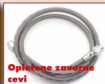
Opletene zavorne cevi