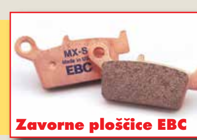
Zavorne ploščice EBC

Taborska 6, 1230 Domžale tel.: +386 1 724 80 63 fax: +386 1 724 80 64 gsm: 041 631 702 e-mail: maj.klub@siol.net