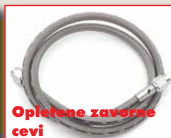
Opletene zavorne cevi

Taborska 6, 1230 Domžale tel.: +386 1 724 80 63 fax: +386 1 724 80 64 gsm: 041 631 702 e-mail: maj.klub@siol.net