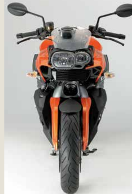
Pravzaprav sploh ni grd.

Marsikdo se je čudil, čemu tak miselni preskok? Menda je bila ideja obeh novih modelov predvsem draženje ne-potencialnih kupcev in s tem vstop v razred, kjer BMW ni bil prisoten. Cilj je bil odrezati še večji kos pogače (ali bi lahko bilo drugače?). Čeprav smo modelu K1200S, torej tistemu z oklepom, očitali, da je kar malce preveč japonski, pa navedu neizvirnosti ne moremo očitati. Mislim, če kdo uspe tega Bavarca zamenjati za kakšnega Japonca, naj se raje ukvarja s šahom in pusti motorje pri miru. Seveda je bilo na račun oblike marsikaj izrečenega. Pogost komentar je bil, da motocikel s svojimi asimetričnimi žarometi in nenavadnimi prednjimi vilicami izgleda, kot da je bil že kdaj fino karamboliran. Sicer pa, če še z malce zlobe pogledamo konkurenco, kakšnega Su-