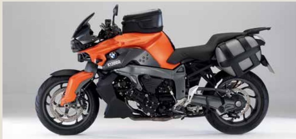
Slečeni R je opazen motocikel. V živo deluje mišičasto, skoraj roboto. Moško. Ker motor odlično vleče in ima vseh 173 konjev v hlevu, postane zadnja guma pri živahni vožnji potrošni material.