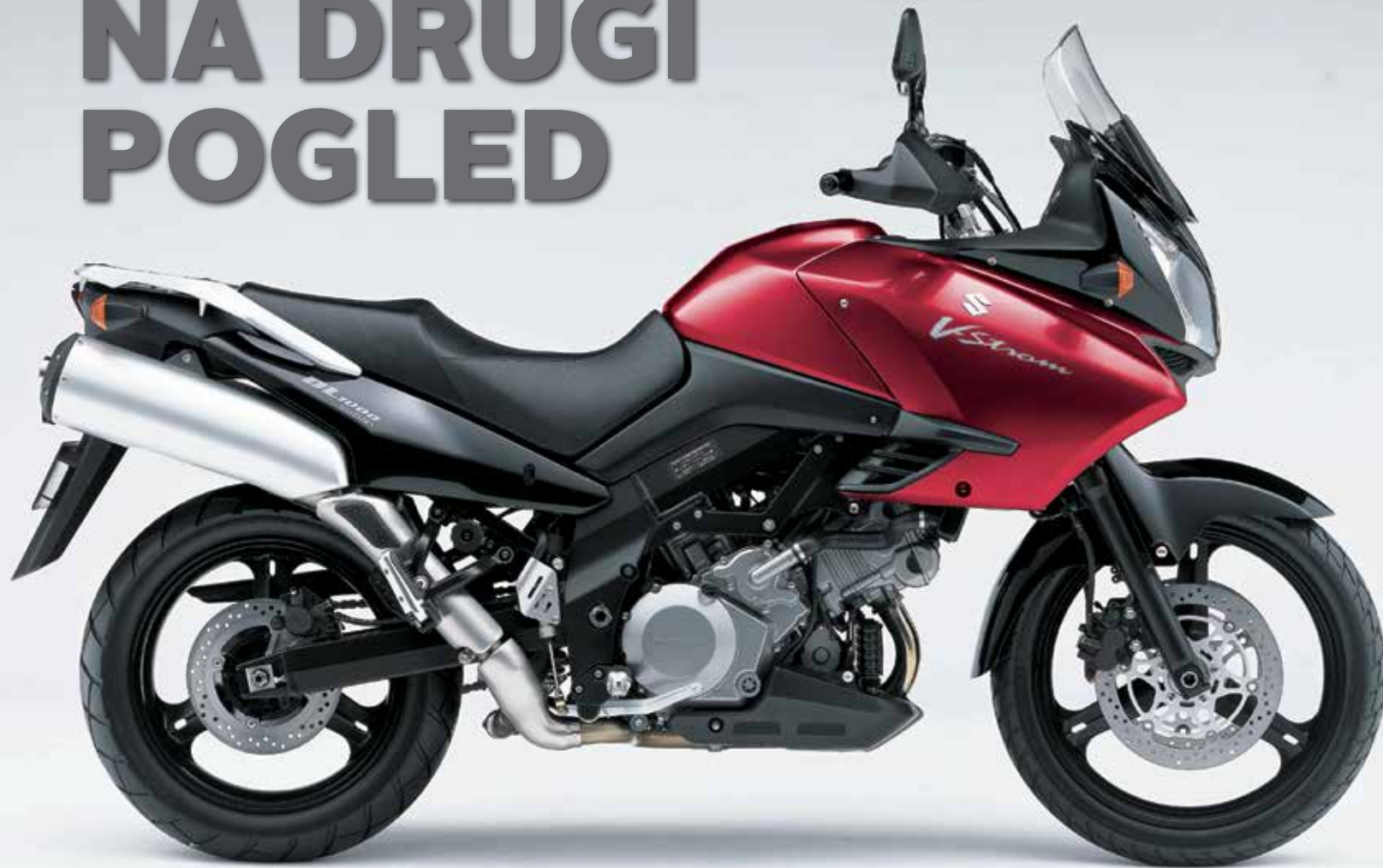
Analizira: Matjaž Gustinčič

Za večino motoristov, ki iščejo udoben vsestranski in zanesljiv potovalnik, stari V-Strom še vedno »odkljuka vse kvadratke«, bi rekli Angleži. Kar ne pomeni, da je idealen. Idealen je menda GS.