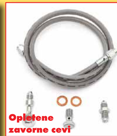
Opletene zavorne cevi