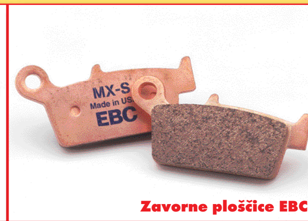
Zavorne ploščice EBC